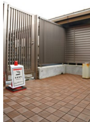
◀市役所屋上に設置された特定屋外喫煙場所

大会時は、臨時喫煙所を設置する。 施設の照明をLEDに照度向上を 議員 市役所や文化会館の会議室の照明が暗いので、LEDに交換し、照度の改善は図れないか。また、スポーツセンター第1競技場の窓側の照明が暗い。 財務部長 市役所は、ロビーや廊下等のLED化を進めてきた。会議室を含め計画的に交換する。 市民生活部長 スポーツセンターは、大規模改修工事にLED照明導入を検討する。